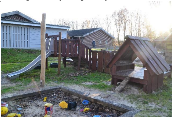
Redskab: Klatrestativ med rutsjebane Årgang: 2013 Producent: Leika Er redskabet mærket: Ja Er der registreret fejl/mangler: Ja