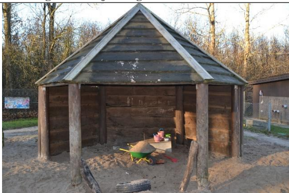
Redskab: Hytte Ikke omfattet af DS/EN 1176