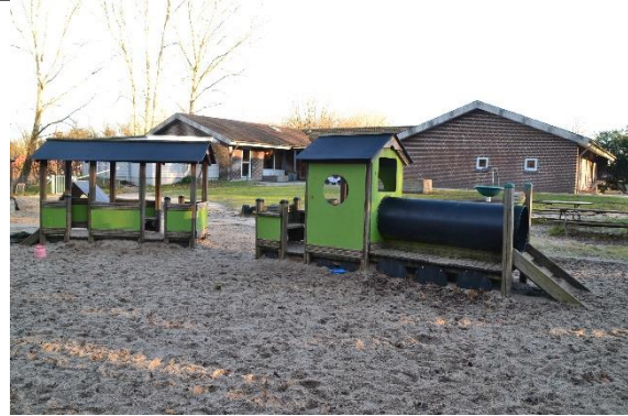
Redskab: Legetog Årgang: 2007 Producent: Er redskabet mærket: Ja Er der registreret fejl/mangler: Nej