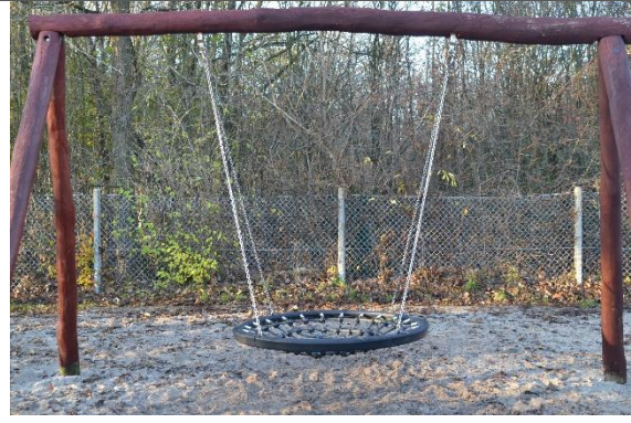
Redskab: Fugleredegynge Årgang: 2010 Producent: Danske Legepladser Er redskabet mærket: Ja Er der registreret fejl/mangler: Ja