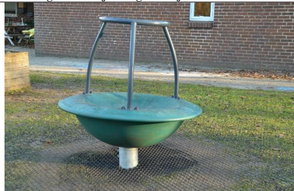
Redskab: Karrusel Årgang: 2022 Producent: Kompan Er redskabet mærket: Ja Er der registreret fejl/mangler: Nej