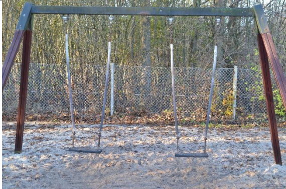
Redskab: Gyngestativ Årgang: 2007 Producent: Er redskabet mærket: Ja Er der registreret fejl/mangler: Ja