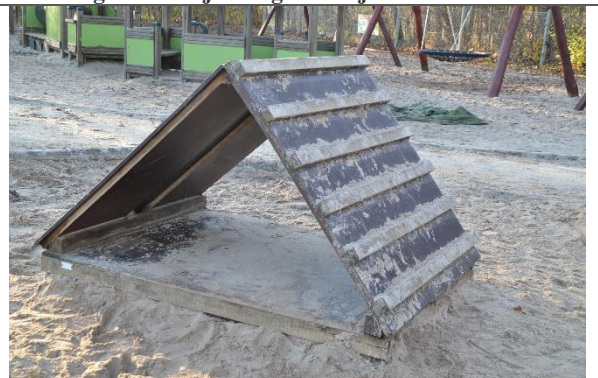
Redskab: Klatrevæg Årgang: 2003 Producent: Er redskabet mærket: Ja Er der registreret fejl/mangler: Nej