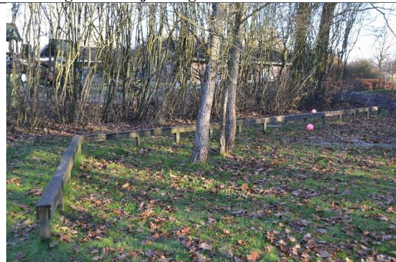
Redskab: Balancestolper Årgang: Producent: Er redskabet mærket: Nej Er der registreret fejl/mangler: Nej