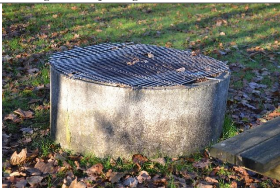
Redskab: Bålsted Ikke omfattet af DS/EN 1176