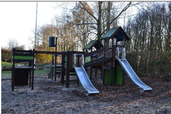
Redskab: Klatrestativ med rutsjebaner Årgang: 1992 Producent: Krea Er redskabet mærket: Ja Er der registreret fejl/mangler: Ja