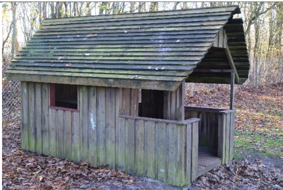
Redskab: Legehus Årgang: 2006 Producent: Er redskabet mærket: Ja Er der registreret fejl/mangler: Ja