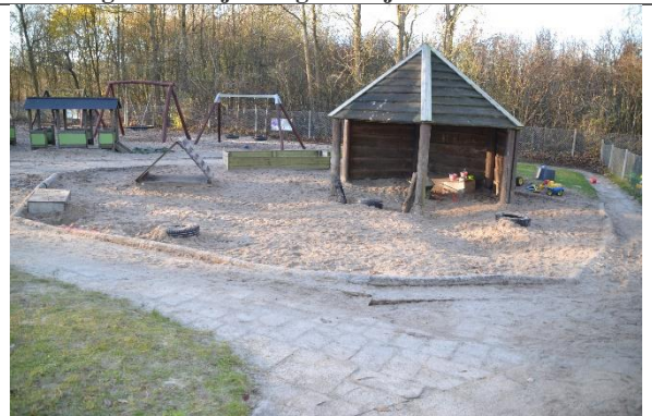
Redskab: Sandkasse Årgang: Producent: Er redskabet mærket: Nej Er der registreret fejl/mangler: Nej