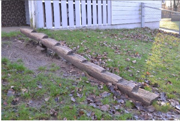
Redskab: Terræntrappe Årgang: 2010 Producent: Er redskabet mærket: Ja Er der registreret fejl/mangler: Nej