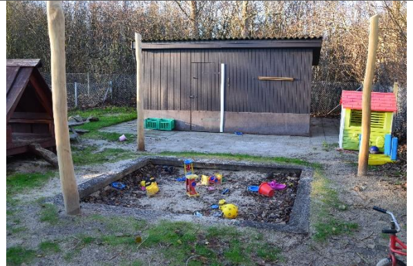
Redskab: Sandkasse med stolper til læsejl Årgang: 2022 Producent: Kompan Er redskabet mærket: Ja Er der registreret fejl/mangler: Nej