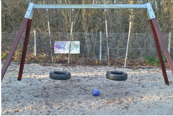
Redskab: Gyngestativ Årgang: 2005 Producent: Ludus Er redskabet mærket: Ja Er der registreret fejl/mangler: Ja