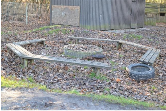
Redskab: Bålplads Ikke omfattet af DS/EN 1176